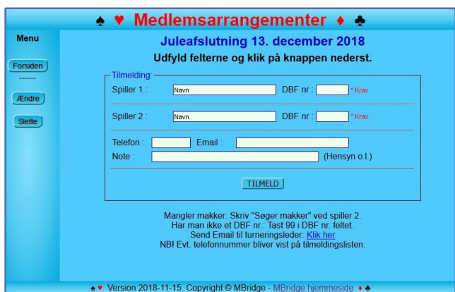
Figur 3: Tilmeldingsblanket.

Blanketterne administreres under Admin knappen næst nederst til venstre på figur 2. Altså på Niveau 2.